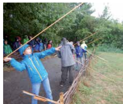
Les enfants du camp résidentiel ont séjourné au village lacustre de Gletterens.

En été, comme chaque année, les deux camps-nature organisés pour les plus jeunes ont fait le plein. Lors du camp