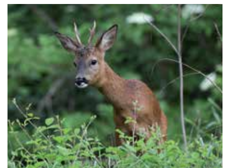
Le chevreuil est un hôte discret des lisières.

172 groupes ont suivi une animation en 2017, ce qui correspond à une augmentation de 36% par rapport à 2016. Le nombre de classes d'école mais aussi de familles et d'entreprises ont augmenté de manière réjouissante. Les thèmes les plus demandés ont été: le centre-nature (56), l'étang (29) et les réserves naturelles (28). Les anniversaires pour enfants ainsi que l'animation sur