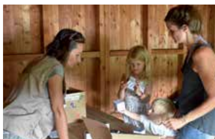
Les postes interactifs de la Journée Portes Ouvertes sur le thème des migrations ont fasciné petits et grands.

BirdLife de la Sauge. Les excursions matinales « Au réveil des oiseaux » et la sortie « La Sauge au coucher du soleil » sont toujours très appréciées (42 et 34 participants). Les soirées estivales ont attiré moins de public qu'en 2016 : nous imputons cette baisse de fréquentation au déplacement de la famille de castors vers le canal de Broye. La traditionnelle Journée portes ouvertes a eu lieu le 27 août : 142 personnes ont découvert le domaine de la Sauge en participant au rallye concours en plein air et aux différents ateliers. Le centre-nature a aussi proposé des activités spéciales lors de la journée internationale des migrations qui a pu inspirer 109 visiteurs. Pour finir, le centre-nature BirdLife de