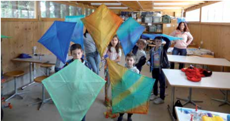
Lors de l'après-midi en famille, les participants ont construit des cerfs-volants très colorés.