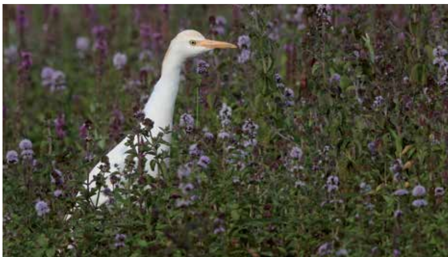
Héron garde-boeuf profitant de la riche offre en insectes des prairies du grand étang.

Le bas niveau de l'eau a exondé des grandes zones de vase qui ont profité aux différentes espèces de limicoles. Les observations ont été le plus diversifiées en mai (11 espèces vues sur 18), tandis que la plus part des individus ont été observés lors de la migration d'automne (57% des observations de l'année). Les espèces les plus fréquentes: le courlis cendré (127 observations, maximum 58 individus le 30 août) ; le chevalier culblanc (101 observations) ; le chevalier guignette (47 observations) ; le chevalier sylvain (47 observations, contre 10 seulement en 2016). Dès le mois de juillet, la présence constante des petits gravelots (31 observations, une seulement en 2016) a mis en évidence les conditions de nourriture favorables pour cette espèce. A noter également le retour en masse des combattants variés après plusieurs années de défection : 34 individus le 24 mars pour un total de 36 observations. Autres observations remarquables : une échasse blanche le 7 mai ; une barge rousse entre le 11 et le 15 mai ; un courlis corlieu le 9 mai ; deux bécasseaux de Temminck le 7 mai ; un bécasseau cocorli les 2 et 17 septembre.