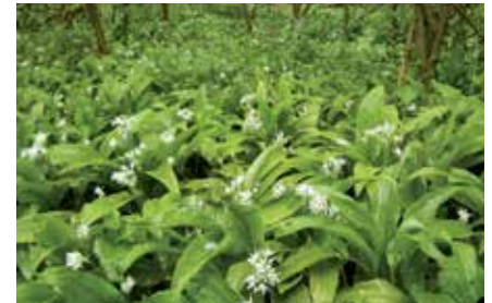
Comme chaque printemps, l'ail des ours tapis la forêt de son beau manteau vert.

Le centre-nature BirdLife de La Sauge a inauguré le 6 mars la saison 2017, en collaboration avec l'Auberge de la Sauge. La saison a enregistré une