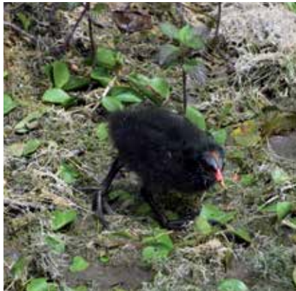
Un poussin de gallinule poule d'eau.

Au grand étang, un couple de cygnes tuberculés a essayé, à plusieurs reprises mais sans succès, de construire un nid en dessous du ponton qui mène à l'observatoire de la rainette. Trois couples de foulques macroules ont nidifié au grand étang. Cependant, seulement un couple a réussi à élever un unique jeune : les autres œufs ont été victimes des goélands leucophées. Ces derniers ne se sont pas reproduits à la Sauge, même si un couple a montré au mois d'avril un comportement de parade et d'accouplement sur l'île du grand étang. A partir du mois de juin, trois couples de grèbes castagneux ont séjourné. En raison de la faible profondeur de l'eau et du comportement agressif des foulques macroules, les grèbes castagneux n'ont pas achevé la construction de leur nid, en dépit des nombreux essais. Le 8 juin, un couple d' oies cendrées avec des poussins âgés de quelques jours est apparu sur le site. Aucun nid n'a été repéré, mais la fa-