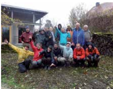
En dépit de la pluie, la journée d'entretien s'est déroulée dans une atmosphère chaleureuse.

L'équipe du centre-nature s'engage en faveur des surfaces extérieures : elle a employé son énergie à favoriser la biodiversité et à rendre le centre-nature encore plus accueillant. Une belle nouvelle table de pic-nic et des bancs en bois ont été installés. Ils permettent aux visiteurs de se reposer en profitant de la nature verdoyante des alentours. Afin de garantir la pérennité du site de nidification du martin-pêcheur, une nouvelle paroi de sable a été construite au petit-étang. Nous espérons que nos flèches bleues apprécieront leur nouveau logis !