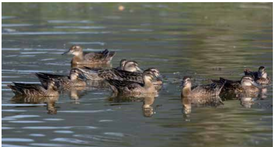
Rassemblement exceptionnel de sarcelles d'été sur le grand étang.

La nidification d'un couple d' effraie des clochers a été suivie depuis la ferme grâce à la caméra installée dans leur nid. A la mi-juin, quatre jeunes chouettes ont pris leur envol. Ensuite, la femelle a pondu une seconde fois six œufs, dont seulement deux ont survécu. Les jeunes se sont envolés au mois d'octobre. L'abondance des rongeurs explique cette première double