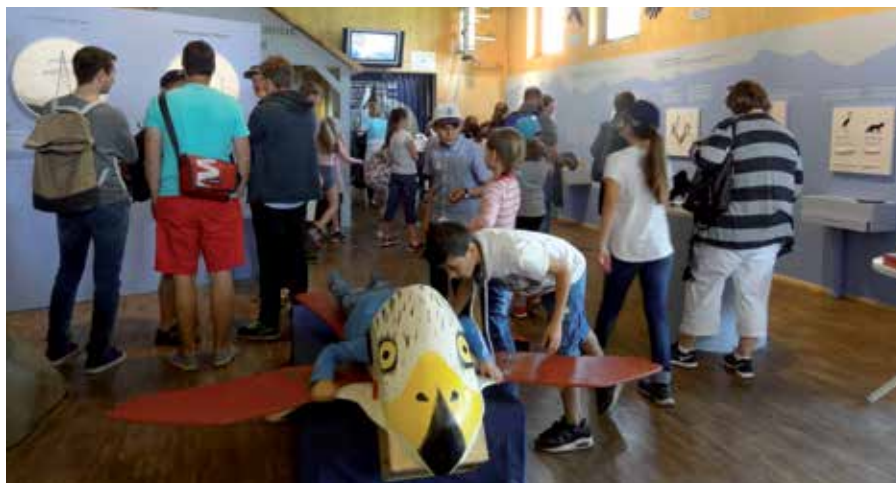
L'exposition « Les maîtres du ciel » est accessible à un large public.

le castor, nouveautés 2017, ont aussi connu un discret succès.