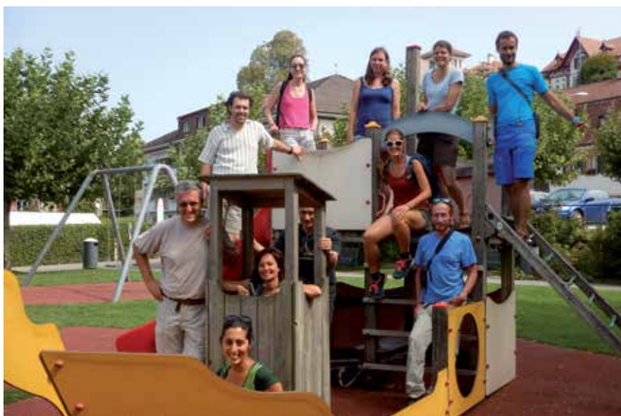
L'équipe de la Sauge au complet lors d'un moment de détente en fin de saison.